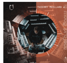
MOOG PROJECT AVRIL 2023