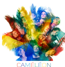
ENSEMBLE CAMÉLÉON MARS 2022