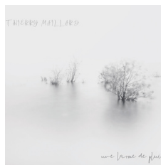
UNE LARME DE PLUIE SEPT 2022