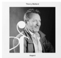
ASGARD SEPT 2023