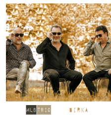
MLB TRIO BIRKA NOVEMBRE 2021