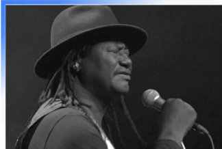
Abdoulaye Nderguet Auteur, compositeur, interprète